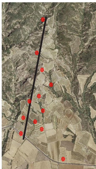
Figura 1 Transecto de los perfiles caracterizados en Secastilla (DO Somontano)