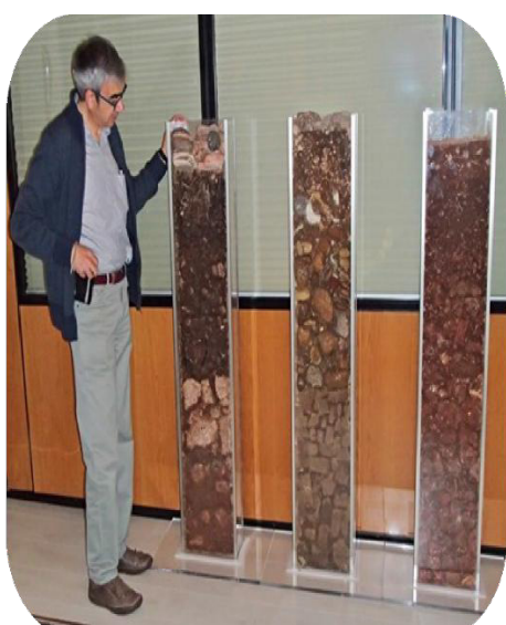
Figura 2: Monolitos de suelos mostrando los diferentes horizontes en cajas de metacrilato