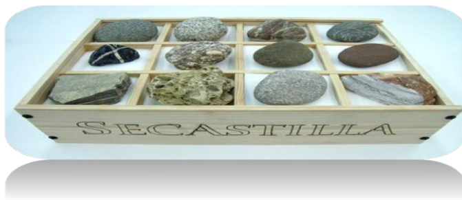
Figura 1: Caja de rocas representando los diferentes orígenes geológicos de los suelos de Secastilla