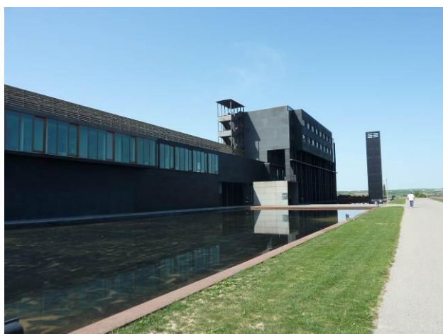
Figura 2. Bodegas Laus en la DOP Somontano

Los dos indicadores relativos a las bodegas muestran plena coherencia entre sí, pudiendo identificarse claramente dos grupos: por un lado, Calatayud, Campo de Borja y Cariñena presentan valores altos en el número de viticultores por bodega, lo que refleja un peso reducido del modelo château en ellas; sus bodegas son, prácticamente en su totalidad, estrictamente funcionales. Los valores mucho más bajos del indicador viticultores por bodega en Costers del Segre, Somontano, Rioja y Navarra indican una mayor importancia del modelo château , lo cual resulta coherente con la existencia de una significativa proporción de bodegas monumentales; valgan como ejemplo de cada una de estas DOP, en el orden en que han sido citadas, las bodegas Raimat, Lauss (figura 2), Marqués de Riscal o Aroa.